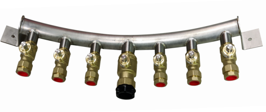
Manifold med messing JCH kuleventiler